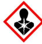
GHS08 – Serious health hazard