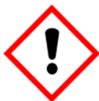
GHS07 – dráždivé látky