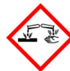
GHS05 – korozivní a žíravé látky