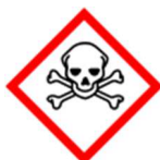
GHS06 – toxické látky