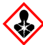
GHS08 – látky nebezpečné pro zdraví