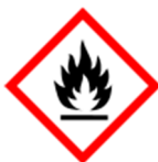
GHS02 – hořlavé látky

Výstražné symboly nebezpečnosti – označování nebezpečných chemických látek a směsí, např.: