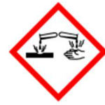
GHS05 – Corrosive